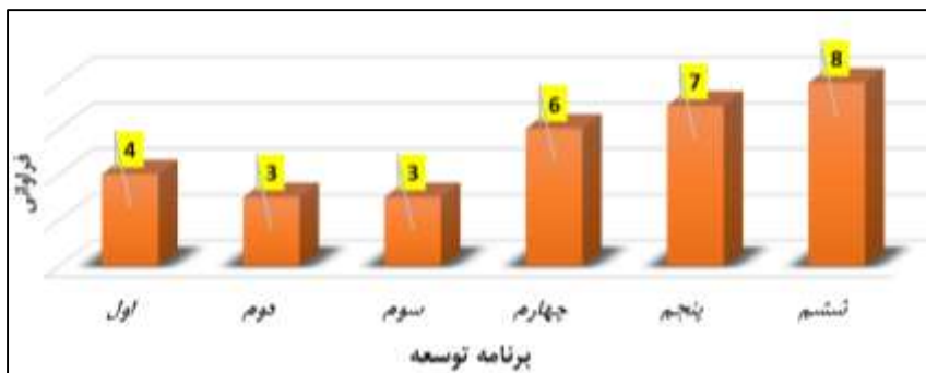
شکل شماره ۲. نمودار مقایسه فراوانی قوانین مرتبط با کیفیت زندگی سکونتگاه‌های مرزی در برنامه‌های پنج‌ساله توسعه ایران

"کیفیت زندگی سکونتگاه‌های مرزی ایران" در محتوای برنامه‌های مذکور به شمار می‌رود چراکه از آن زمان به بعد، همراه رویکرد رو به رشدی حاکم شده است.