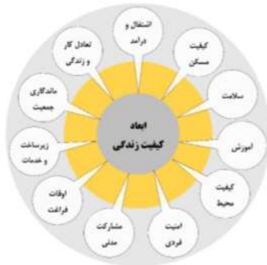
شکل شماره ۱. ابعاد کیفیت زندگی، منبع: (OECD, 2014: 15)

رویکردهای مربوط به کیفیت زندگی تاکنون در چهار دسته روان‌شناختی، جامعه‌شناختی، اقتصادی و بوم‌شناسی تبیین شده است. در چارچوب رویکردهای مذکور، نظریاتی مرتبط با مسئله کیفیت زندگی عرضه شده که در ادامه به بیان تعدادی از موارد مرتبط با تحقیق پرداخته شده است: